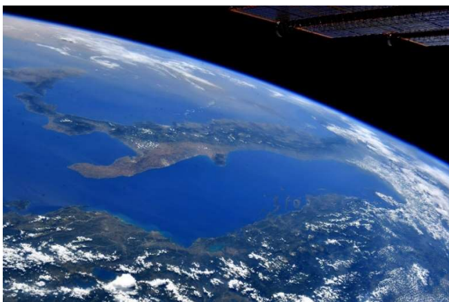
Terra, Italia e litorale balcanico, immagine di Samantha Cristoforetti dalla ISS, 2 giugno 2022 (NASA/ESA)